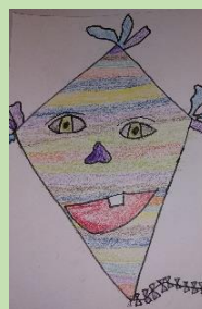
Lucie Jeneiová, 5. ročník, nakreslil Dan Komzák, 2. ročník