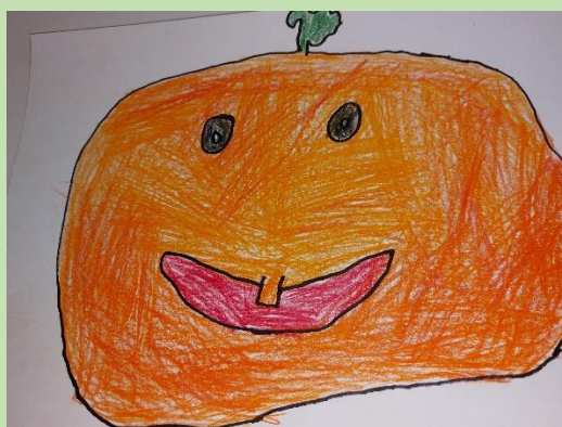
Tereza Pelánová 5. roč., nakreslil Tobík Komzák, 1. ročník

Stezka se šla kolem náměstíčka a obchodu směrem ke staré hospodě, kde nás čekala strašidelná pergola. Děti přišly v maskách a stezku si bezvadně užily.