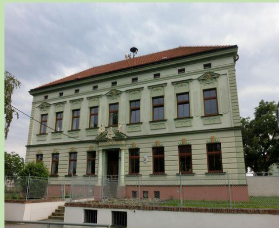
Naše základní škola